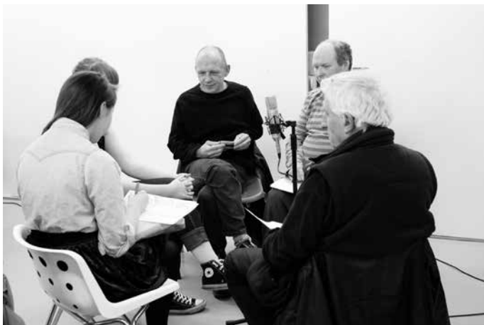
Rosas: The Attic 2012 Production still

At times, the focus of this process works like the MacGuffin described by Hitchcock, a device that merely serves as an instrument for navigating and exploring what is really at stake; although the idea may be at the center of the work, it certainly is not its subject. The real subject lies in the political undertones of the participants' multiple voices.